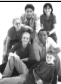
Le Retour des débrouillards

Magazine d'actualité avec participation active d'un auditoire; débats sur des sujets controversés; interaction avec des vedettes des médias; jeux interactifs à fonctions multiples; babillard électronique; boutique; musique et vidéoclips.