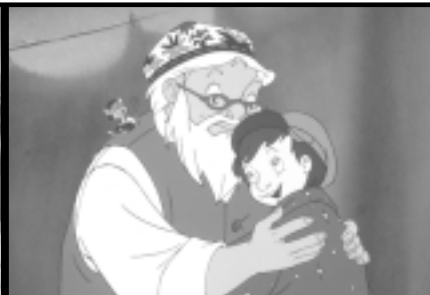
Something from Nothing