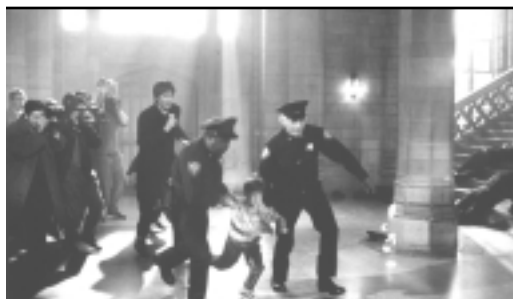
Jacob Two-Two Meets the Hooded Fang

Parents d'aujourd'hui 5000 visites par semaine